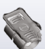
• Tragbarer Halter